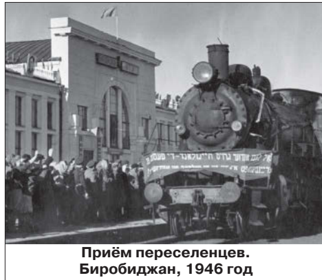
Приём переселенцев. Биробиджан, 1946 год

Однако положительный сдвиг был сведён на нет прокатившейся по всему Советскому Союзу официальной антисемитской кампанией. В рамках кампании были ликвидированы в стране все учреждения еврейской культуры, арестовано большинство писавших на идише авторов, расстреляны члены Еврейского антифашистского комитета. Не обошла эта кампания и ЕАО. Здесь она вылилась в так называемое «биробиджанское дело». Было прекращено преподавание идиша в школах и педагогическом училище, был ликвидирован еврейский театр. Жители Биробиджана стали свидетелями средневековых зрелищ: во дворе областной библиотеки пылали костры, в которых горели книги на еврейском языке. Это ретивые чиновники сжигали произведения репрессированных еврейских литераторов. Языки пламени поглощали альманахи «Форпост» и «Биробиджан», книги авторов, арестованных и осуждённых на 10 лет ла-