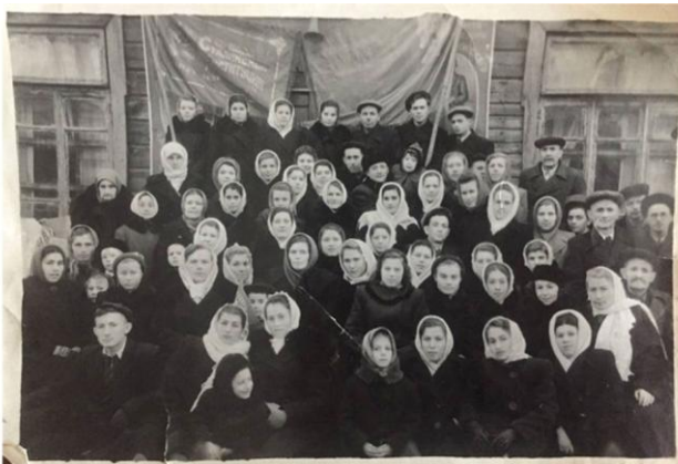
Коллектив артели «Свой труд». 1943 год

Хотя прежняя служба быта за постсоветские годы была позабыта, вспомнить о ней стоит хотя бы потому, что в этом году исполняется восемьдесят пять лет с тех пор, как в Биробиджане появилось первое ателье по пошиву одежды