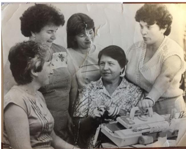
Вязальщицы ателье «Трикотажница». 1985 год.