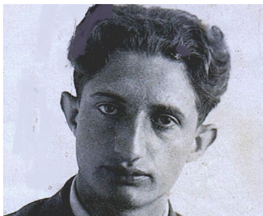
Папа – десятиклассник

После окончания школы в 1941-м попросился в училище красных командиров. Направили на учебу радистов в Ворошилов, ныне Уссурийск в Приморье. В сорок третьем отправили на фронт, в самое пекло - под Сталинград.