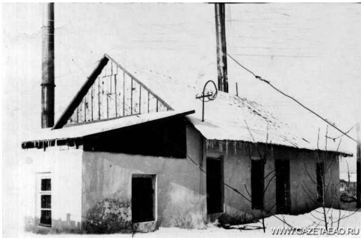
Здание вязального цеха

Артели «Свой труд», «Работница» и фабрика «Ширпотреб» были предшественниками Биробиджанской трикотажной фабрики, которой в этом году исполнилось бы шестьдесят лет