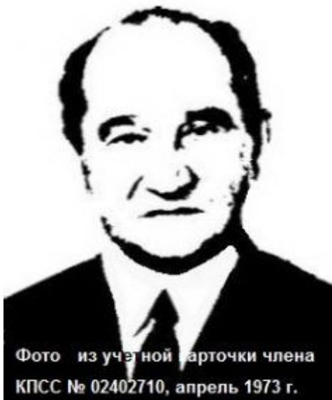
Фото из ученической карточки члена КПСС № 02402710, апрель 1973 г.