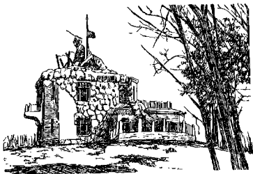
Музей-памятник погибшим героям в бою под Волочаской на озере Июн-Карань

ных. Только благодаря тому, что подпольные большевистские организации по приказу Ревкома создали дружины по охране порядка, которые вызволили многих арестованных, белогвардейцам не удалось уничтожить сотни людей, обреченных на смерть.