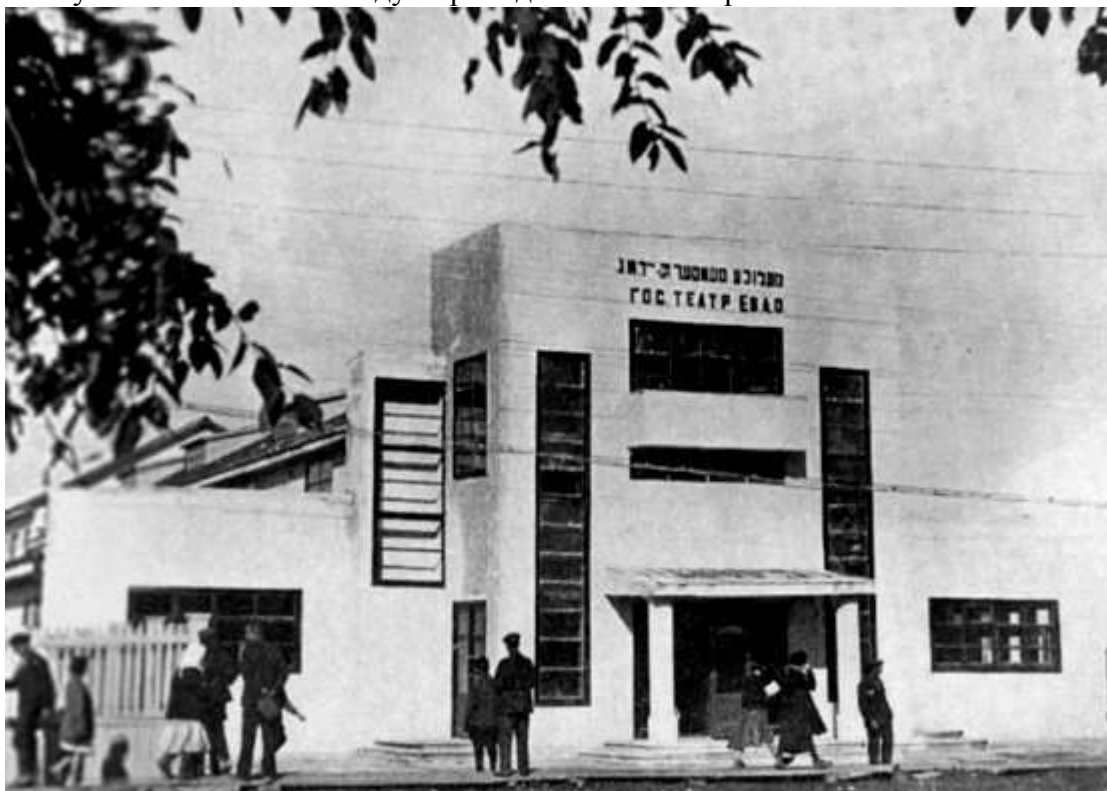
Здание Биробиджанского ГОСЕТа (архивное фото)

Менее двух недель спустя, 23 февраля 1949 г. председатель Комитета по делам искусств СССР Поликарп Лебедев порекомендовал зампредседателя Совета Министров СССР Клименту Ворошилову и секретарю ЦК Маленкову ликвидировать убыточный Московский ГОСЕТ. 24 февраля подобная «рекомендация» поступила от Комитета по делам искусств СССР и по поводу Биробиджанского театра.