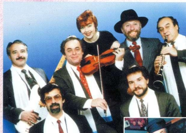
Клезмерский ансамбль «Симха» из Казани