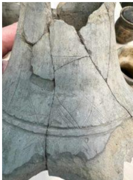
Горловина сосуда, где изображены жилища чжурчжэней под дождем

Сейчас керамической коллекцией занимаются специалисты из Института истории, археологии и этнографии народов Дальнего Востока ДВО РАН совместно с ЦСН Амурской области.